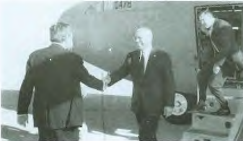
مرحبا بوزير الخارجية كولن باول في مطار بغداد